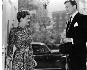
1942 UNE FEMME CHERCHE SON DESTIN (Now, Voyager) d' Irving Rapper avec Bette Davis