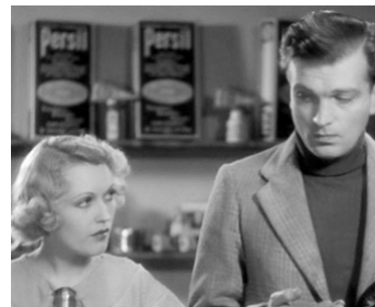
1935 LE MANNEQUIN DE PARIS (It happened in Paris) de Carol Reed avec Nancy Burne