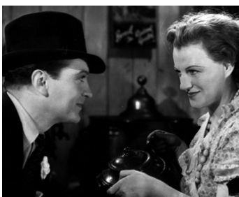
1936 MÉPRISE (Queen of Hearts) de Monty Banks avec Gracie Fields