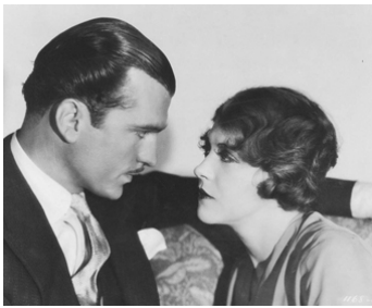
1928 SECRET PROFESSIONNEL (The Doctor's Secret) de William C. DeMille avec Ruth Chatterton