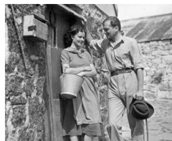
1937 LE VICTORIEUX (Owd Bob) de Robert Stevenson avec Margaret Lockwood