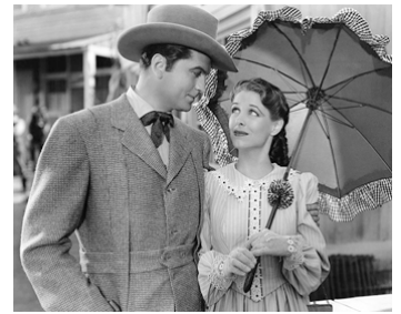
1940 LA FRONTIÈRE DES DIAMANTS (Diamond Frontier) d'Harold D. Schuster avec Anne Nagel