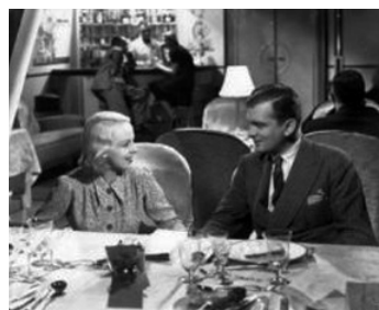
1937 NEW-YORK EXPRESS (Non-stop New York) de Robert Stevenson avec Anna Lee