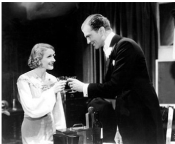
1932 18 MINUTES (Eighteen Minutes) de Monty Banks avec Benita Hume