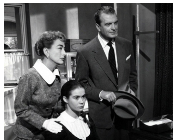
1957 LE SCANDALE COSTELLO (The Story of Esther Costello) de D. Miller avec J. Crawford, H. Sears