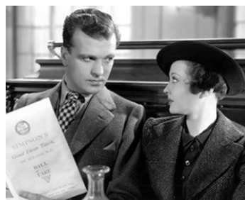
1936 AGENT SECRET (Sabotage) d'Alfred Hitchcock avec Sylvia Sydney