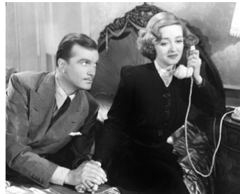
1943 L'IMPOSSIBLE AMOUR (Old Acquaintance) de Vincent Sherman avec Bette Davis