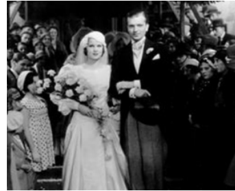
1932 RÉPÉTITION DE MARIAGE (Wedding rehearsal) d'Alexander Korda avec Wendy Barrie