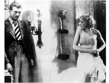
1932 LE CERCLE DE LA MORT (Money for speed) de Bernard Vorhaus avec Ida Lupino