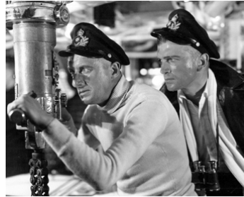
1930 LES CORSAIRES DE L'ATLANTIQUE (Seas Beneath) de John Ford avec Henry Victor