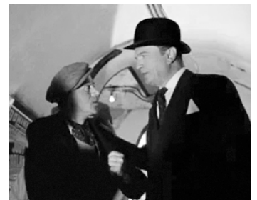
1957 INSPECTEUR DE SERVICE (Gideon of Scotland Yard) de John Ford avec C. Cusack