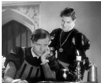
1933 LA VIE PRIVÉE D'HENRY VIII (The private life of Henry VIII) d'A. Korda avec Robert Donat