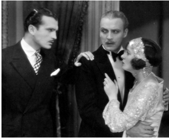
1930 LILLIES OF THE FIELD d'Alexander Korda avec Ralph Forbes, Corinne Griffith