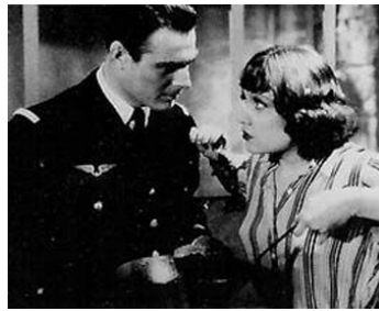
1939 MENACES d'Edmond T. Greville avec Ginette Leclerc