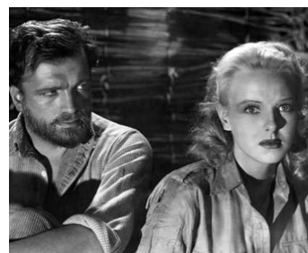
1937 LES MINES DU ROI SALOMON (King Solomon's Mines) de Robert Stevenson avec Anna Lee