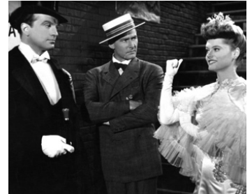
1942 GENTLEMAN JIM (Gentleman Jim) de Raoul Walsh avec Errol Flynn, Alexis Smith