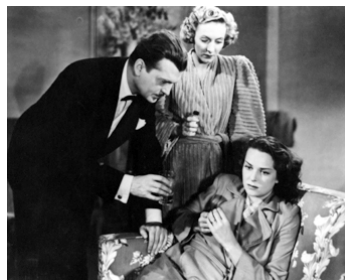
1945 JALOUSIE (Jealousy) de Gustav Machaty avec Jane Randolph, Karen Morley