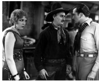
1928 SUNSET PASS d'Otto Brower avec Zane Grey, Nora Lane