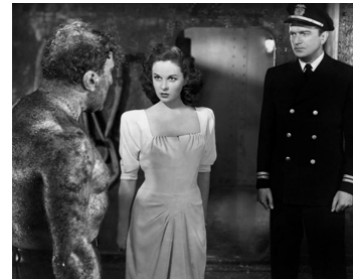
1944 LA BELLE ET LA BRÛTE (The hairy Ape) d'A. Santell avec W. Bendix, Susan Hayward