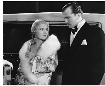
1929 AFFAIRE PRIVÉE (Her private Affair) de Paul L. Stein avec Ann Harding