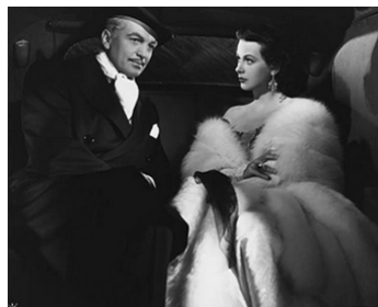
1947 LA FEMME DÉSHONORÉE (Dishonored Lady) de R. Stevenson avec Hedy Lamarr