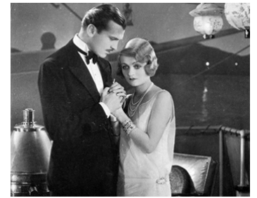
1929 RICH PEOPLE d'Edward H. Griffith avec Constance Bennett