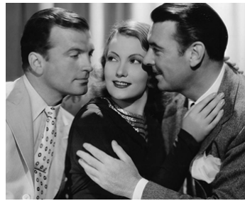
1940 LA FEMME AUX BRILLANTS de George Fitzmaurice avec Isa Miranda, George Brent