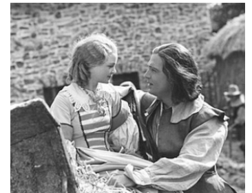
1934 LES MAUDITS DU CHÂTEAU-FORT (Lorna Doone) de Basil Dean avec Victoria Hopper