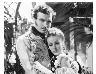
1938 KATIA de Maurice Tourneur avec Danielle Darrieux