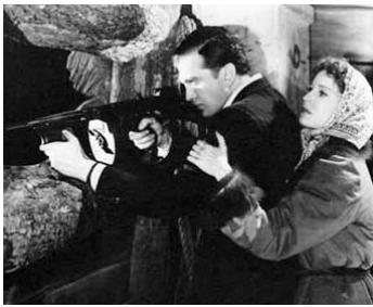
1938 LA BATAILLE SILENCIEUSE (The Silent Battle) d'Herbert Mason avec Valerie Hobson