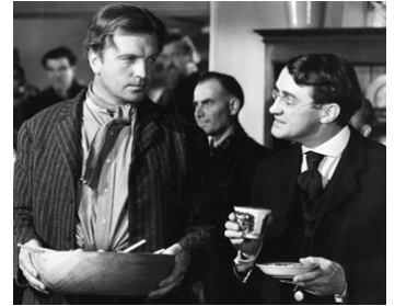
1941 QU'ELLE ÉTAIT BELLE MA VALLÉE (How green was my valley) de J. Ford avec Barry Fitzgerald