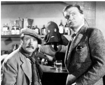
1942 LE MYSTÉRIEUX DOCTEUR (The mysterious Doctor) de B. Stoloff avec Forrester Harvey