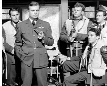
1942 L'ESCADRILLE DES AIGLES (Eagle Squadron) d'A. Lubin avec J. Hall, R. Stack, Leif Erickson