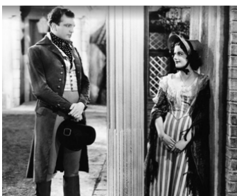
1937 L'ÉNIGMATIQUE DOCTEUR SYN (Doctor Syn) de Roy William Neill avec M. Lockwood