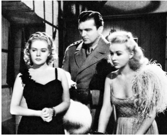
1940 ADIEU BROADWAY (Tin Pan Alley) de Walter Lang avec Alice Faye, Betty Grable