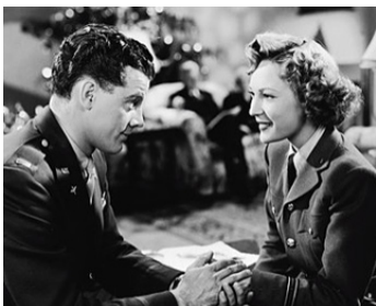
1945 L'ÉTRANGLEUR DE BRIGHTON (The Brighton Strangler) de Max Nosseck avec June Duprez