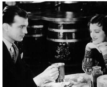
1934 CAPRICES DE PRINCE (Love, Life and Laughter) de M. Elvey avec Gracie Fields