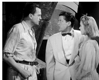
1945 UN JEU DE MORT (A Game of Death) de R. Wise avec Russell Wade, Audrey Long