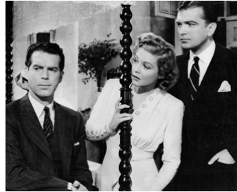
1941 UNE NUIT À LISBONNE (One Night in Lisbon) d'E. Griffith avec F. McMurray, Madeleine Carroll