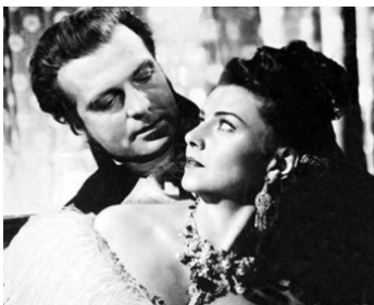
1946 INTRIGUE À LA COUR (The Wife of Monte Cristo) d'Edgar G. Ulmer avec Lenore Aubert